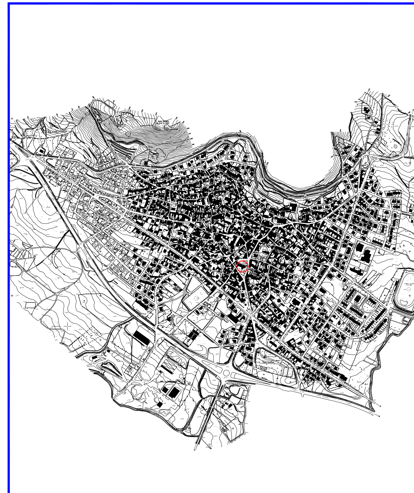
CARTA TECNICA SCALA 1:10 000